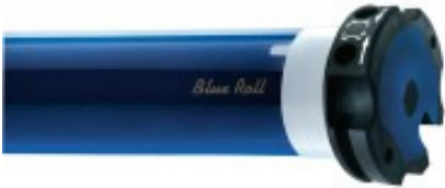
Motore elettrico per tapparelle